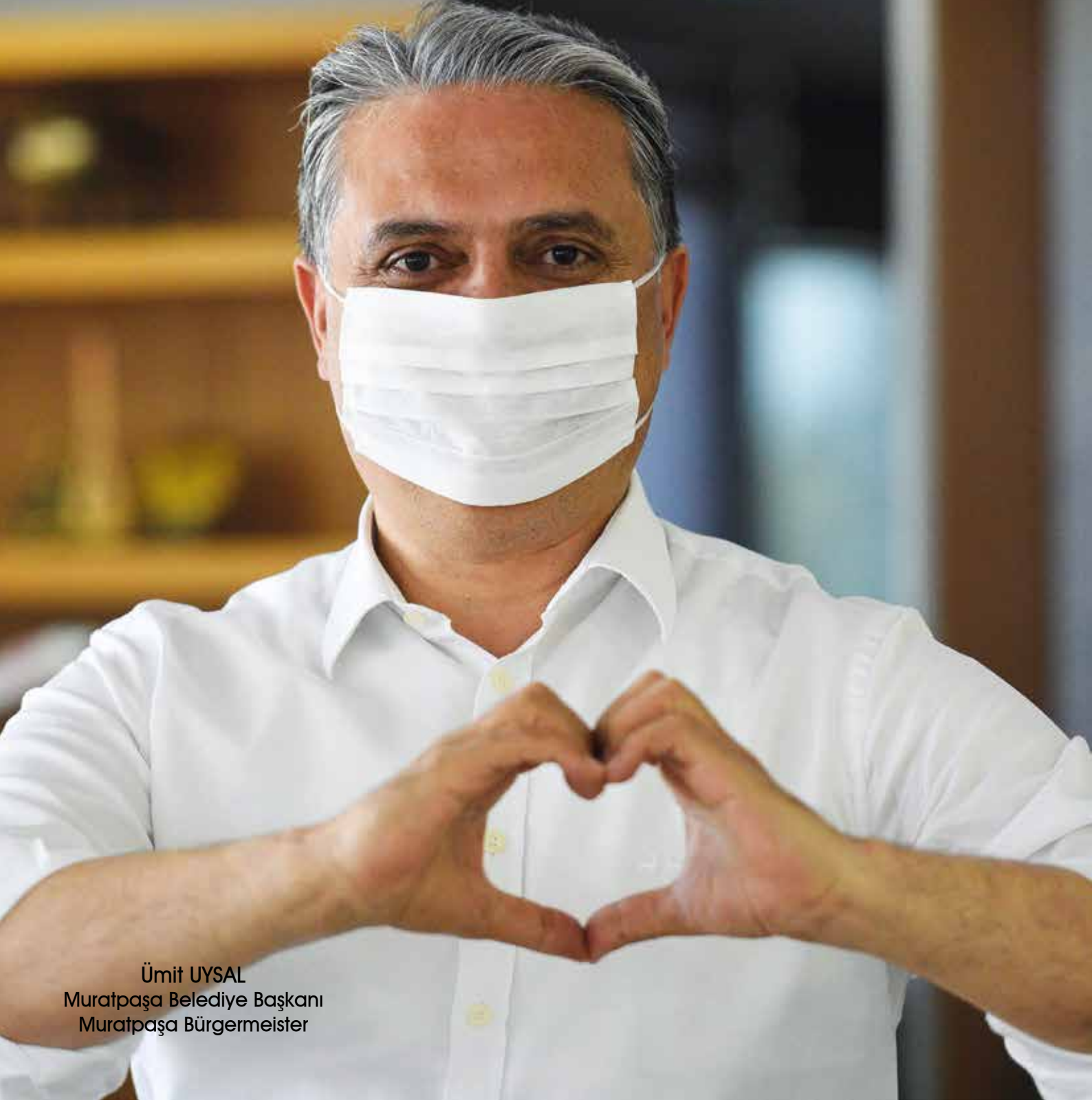
Ümit UYSAL Muratpaşa Belediye Başkanı Muratpaşa Bürgermeister