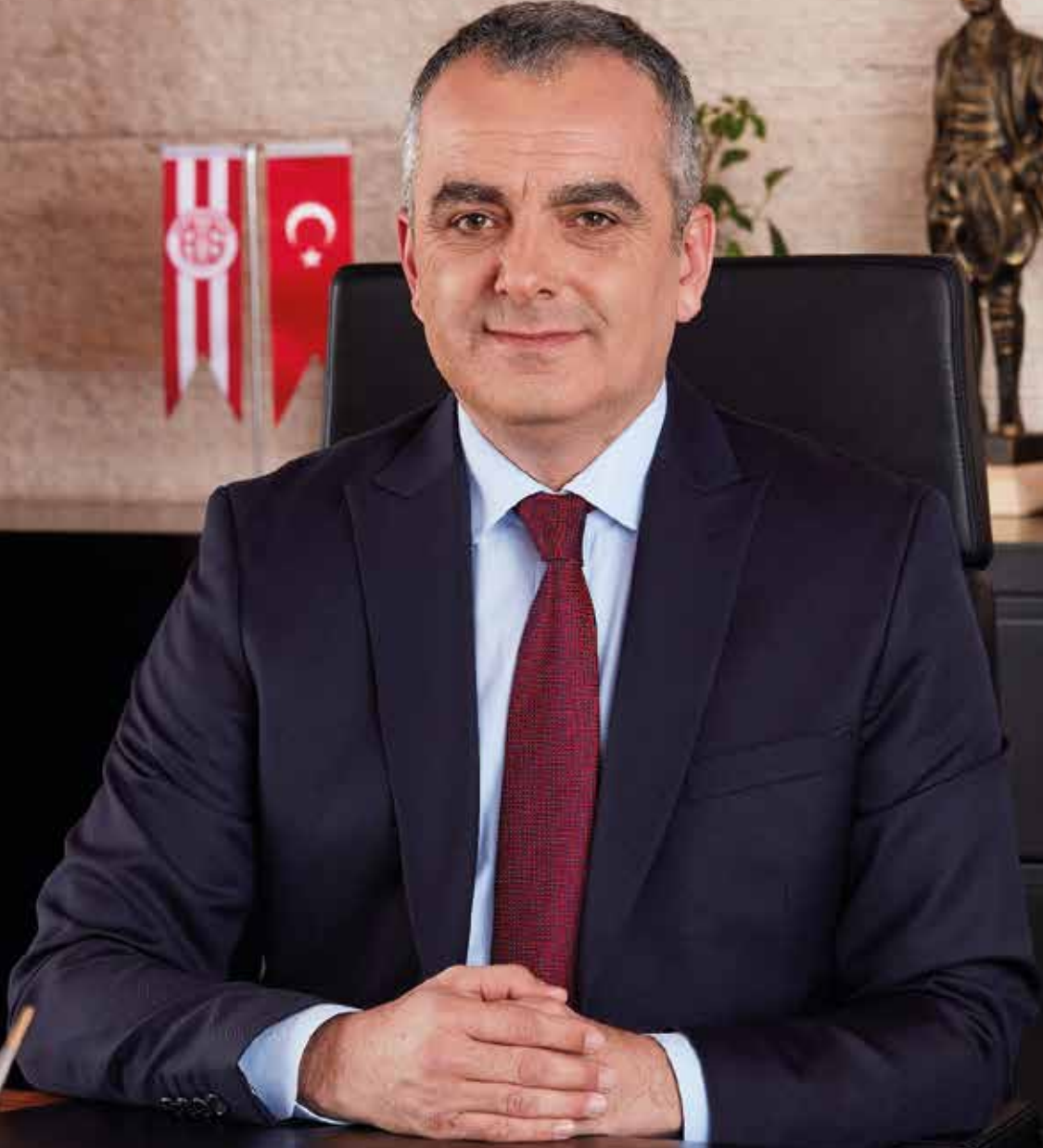
Semih ESEN Konyaaltı Belediye Başkanı Konyaaltı Bürgermeister